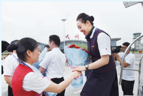
6月28日下午,武冈机场工作人员给首航机组人员献花。