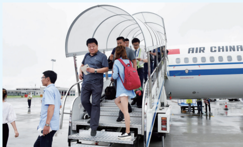
6月28日14时25分,首批乘客到达武冈机场。