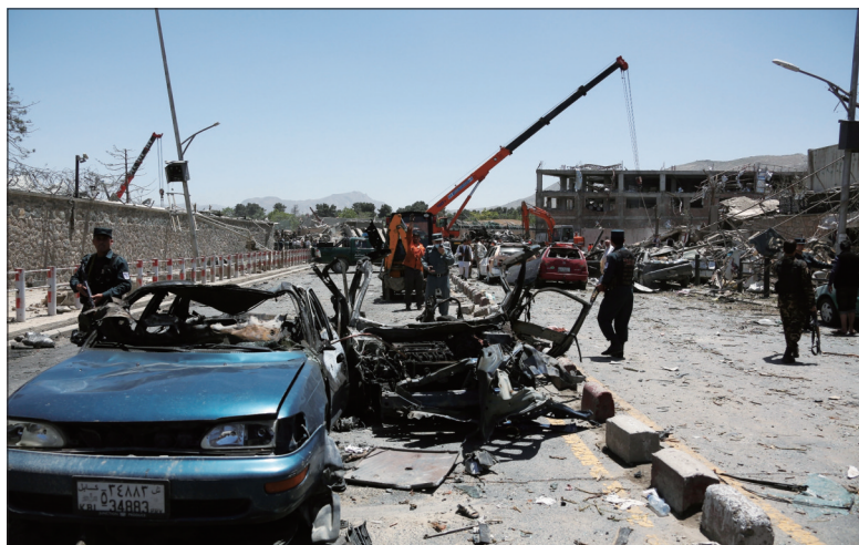
5月31日,阿富汗安全人员在喀布尔爆炸现场工作。

近年来,德意志银行遭遇多起法律诉讼,巨额罚款令其财务压力陡增。2016年,该银行亏损14亿欧元(1欧元约合1.07美元),为连续第二年出现亏损。