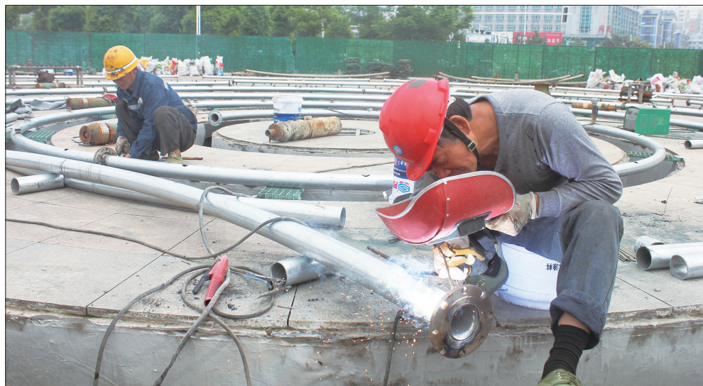
市区魏源广场音乐喷泉升级改造正在紧张施工中。目前,已完成喷泉水池改造和防水层施工,现正在安装喷泉管道,预计整个改造工程将于5月底竣工。图为5月3日,工人正在焊接安装喷泉管道。

5月4日,大祥公安分局还在东湖寺派出所内举行了“狂飙行动”战果展和警营开放日活动。当地群众通过实地参观,对平安大祥的建设有了更深刻的体会。