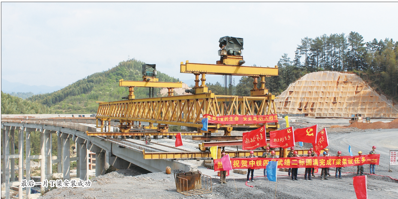
最后一片T梁安装成功