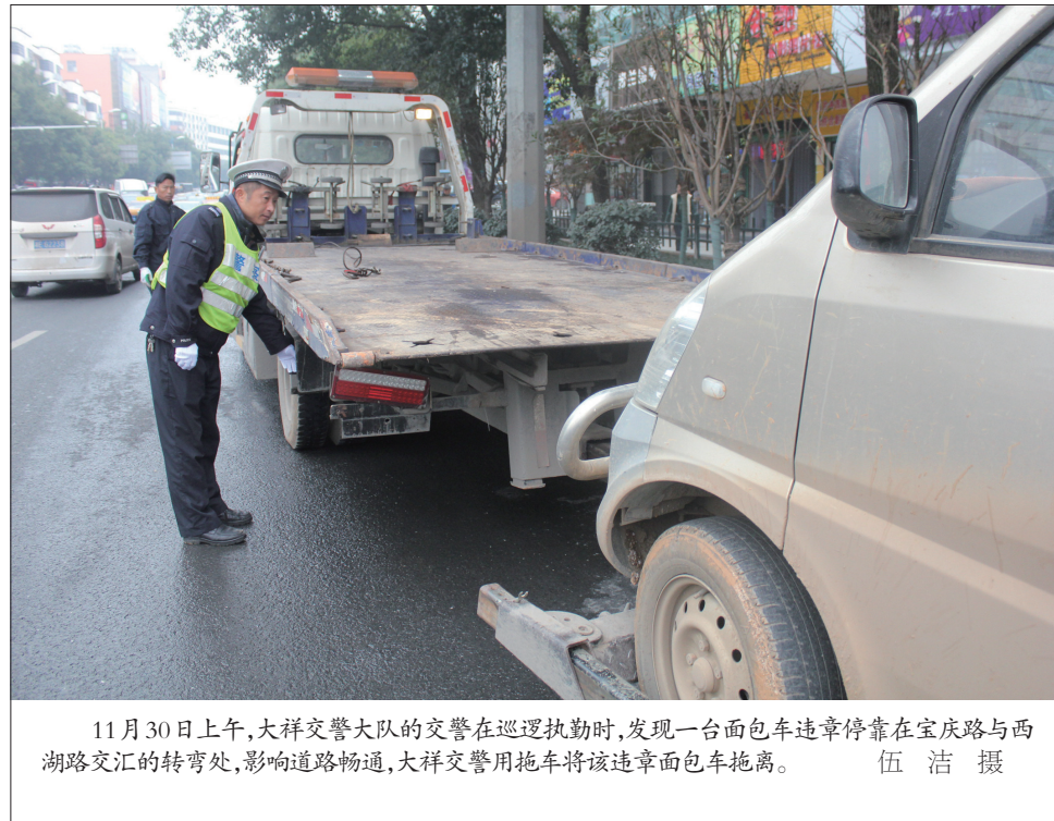
11月30日上午,大祥交警大队的交警在巡逻执勤时,发现一台面包车违章停靠在宝庆路与西湖路交汇的转弯处,影响道路畅通,大祥交警用拖车将该违章面包车拖离。