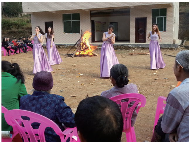
图为篝火联欢会上,村民们正在观看团员青年们的精彩演出。

当天,团员青年们为该村赠送了100多册崭新的书籍和书架,为村民们提供了免费的医检医疗服务,并赠送了一批药