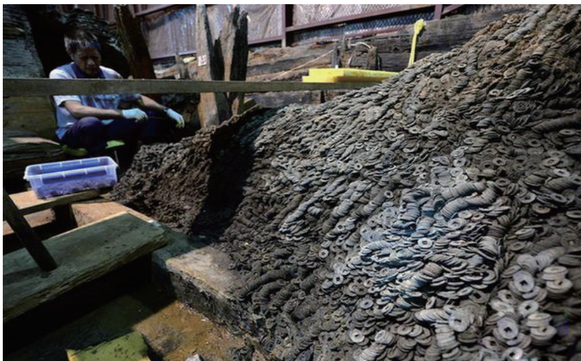
工作人员在海昏侯墓考古发掘现场清理五铢钱

昏侯墓中的200万枚五铢钱有着重大历史意义。借助这一实物证据，海昏侯墓考古专家确认，中国“千文一贯”的货币计量制度在西汉时期就已出现，相比于原先所知的宋代，整整前推了1000余年。