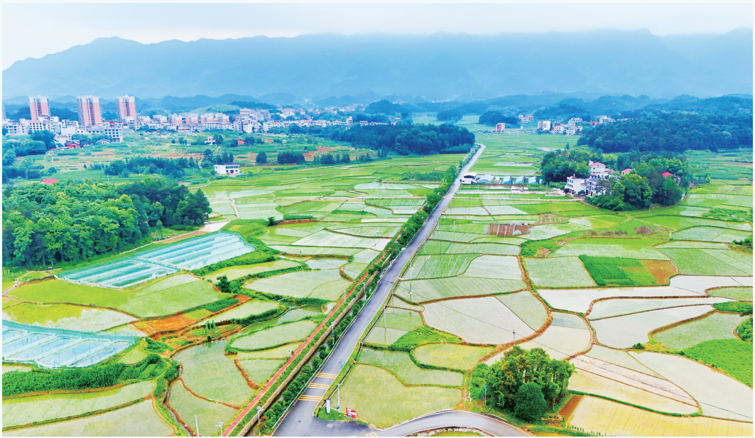
粮田变良田,乡村好“丰”景。

洞口县自然资源局通过这一系列“组合拳”式的举措,在自然资源系统的安全生产工作中取得了显著成效,有效防范遏制了重特大安全生产事故的发生,为县域经济社会稳定发展奠定了坚实的安全基础。