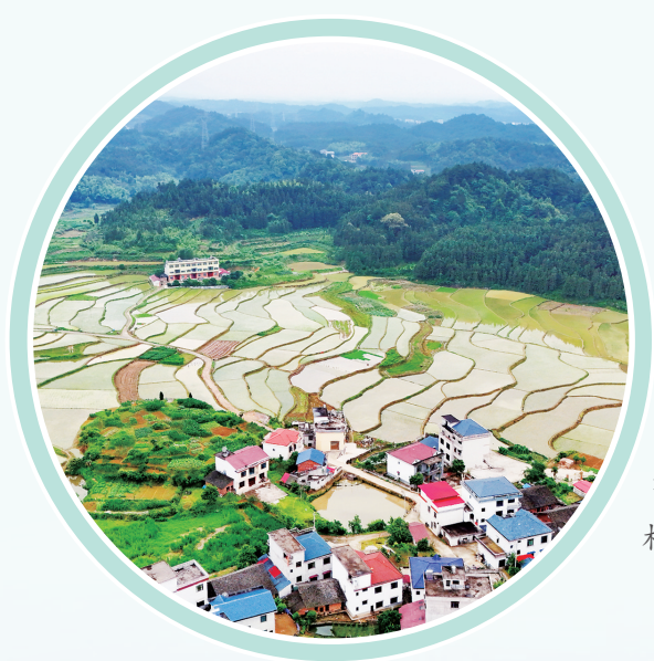
科学规划下的魅力村庄。

2024年来,洞口县自然资源系统紧紧围绕“严守资源安全底线、优化国土空间格局、促进绿色低碳发展、维护资源资产权益”的工作定位,聚焦土地、规划、不动产登记等重点领域,强化政策供给,深化流程再造,优化服务质效,坚定不移完成各项目标任务,助力全县经济社会高质量发展。