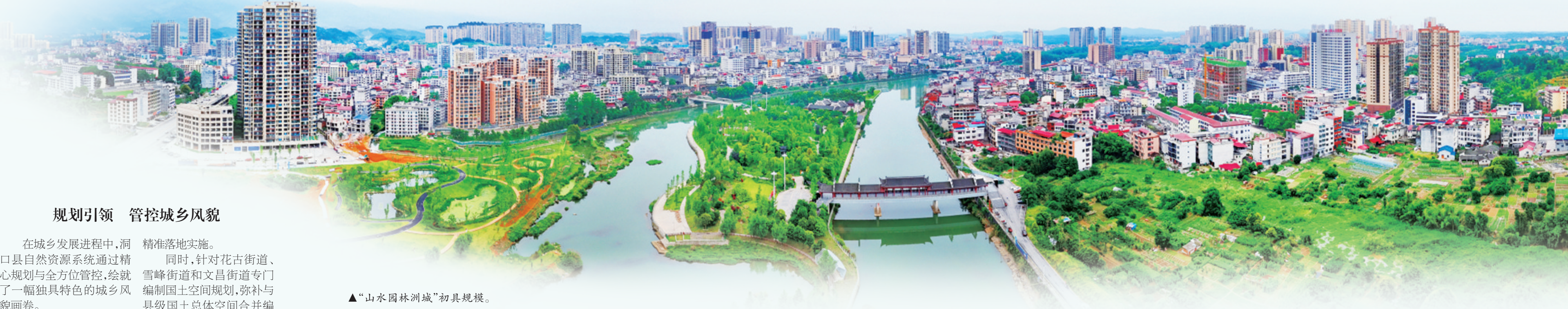
▲“山水园林洲城”初具规模。