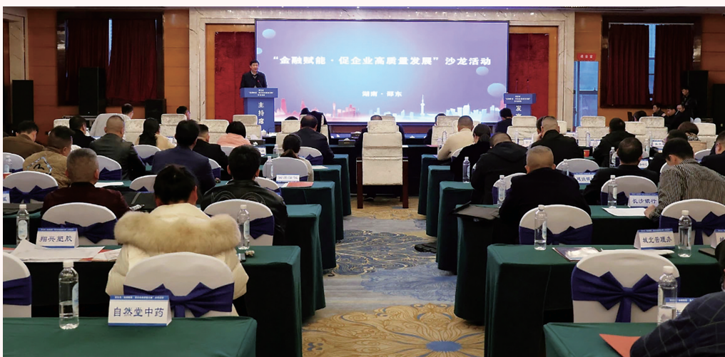
邵东市“金融赋能·促企业高质量发展”沙龙活动。