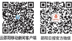
云邵阳移动新闻客户端 邵阳日报官方微信