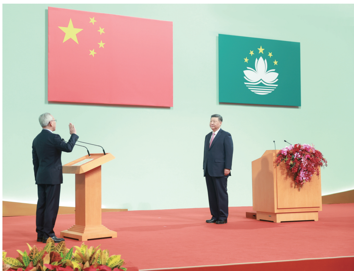
12月20日上午，庆祝澳门回归祖国25周年大会暨澳门特别行政区第六届政府就职典礼在澳门东亚运动会体育馆隆重举行。中共中央总书记、国家主席、中央军委主席习近平出席并发表重要讲话。