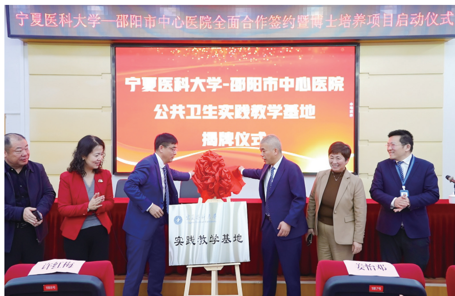
签约仪式现场。

一场签约仪式历时仅不到两小时,背后却凝聚着市中心医院在想方设法聚合资源、为培养人才而不懈努力的点点滴滴。合作的背后,是市中心医院院领导高度重视“发展之需”,奔赴千里走访宁夏医科大学深入调研,组建专班详细洽谈合作模式细则,开展联合考察,制定联合培养人才计划的深谋远虑。