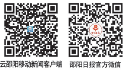
云邵阳移动新闻客户端 邵阳日报官方微信

新华社北京12月5日电 12月5日,国家主席习近平致电内通博·南迪-恩代特瓦,祝贺她当选纳米比亚共和国总统。