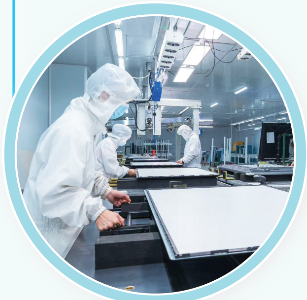
▲创亿达一体机无尘生产车间。

在全市上下的共同努力下,该市打火机产业集群、箱包产业集群先后列入国家级中小企业特色产业集群、省级中小企业特色产业集群;累计建成省级及以上研发机构35家,入库科技型中小企业732家;高新技术企业148家,占规模以上工业企业的比例为21.29%。2023年,邵东市地区生产总值达763.3亿元。