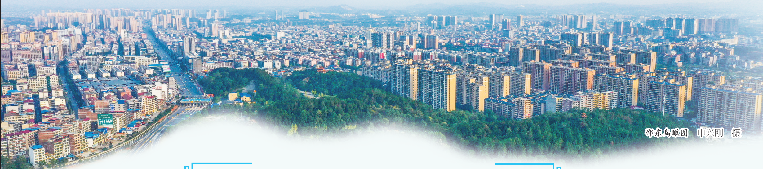
邵东鸟瞰图