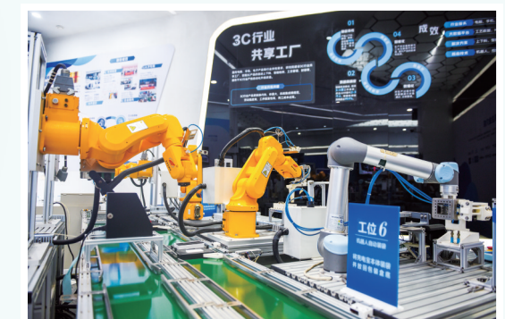
▲邵东智能制造技术研究院机器人自动化展示区。