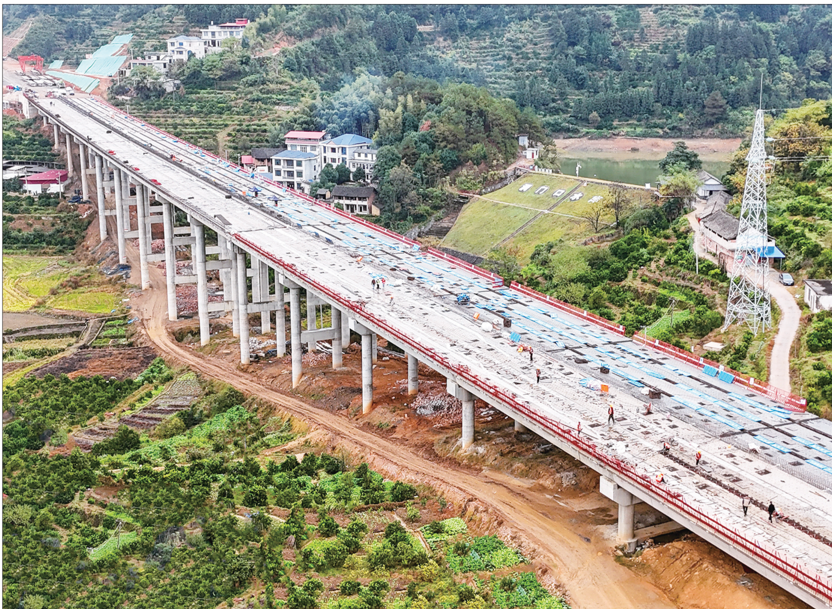
11月17日,新新高速公路二标段二工区工人们正在施工。该工区共有10座高架桥梁,目前已经铺架完成6座,其余4座正在进行桥面施工之中。

当天,周迎春还来到雨泉医养中心,走访市人大代表刘功远,并同他亲切交谈,叮嘱他要依法履行人大代表职责,秉持为民情怀,充分利用现有医疗资源与养老资源,为老人提供全方位、多层次、个性化的医养服务,确保他们生活得舒心、健康,真正实现老有所依、老有所养、老有所乐。