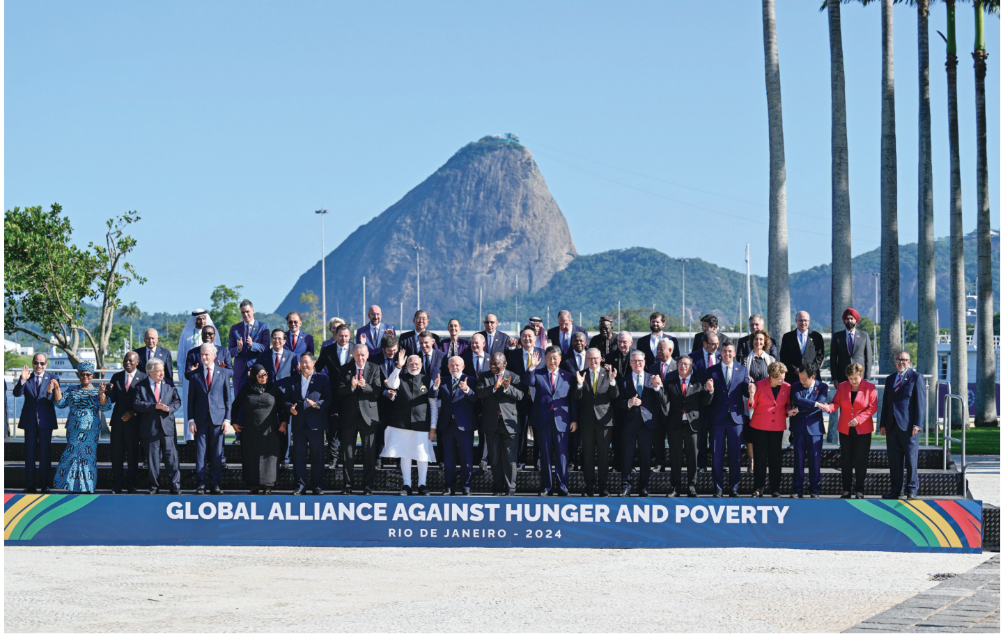
当地时间11月18日上午,国家主席习近平在巴西里约热内卢出席二十国集团领导人第十九次峰会。在峰会第一阶段围绕“抗击饥饿与贫困”议题讨论时,习近平发表题为《建设一个共同发展的公正世界》的重要讲话。