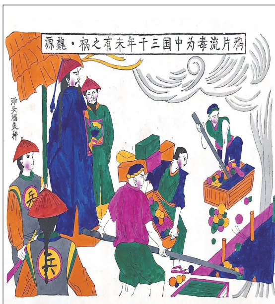
▲滩头木版年画作品《林则徐虎门销烟》。