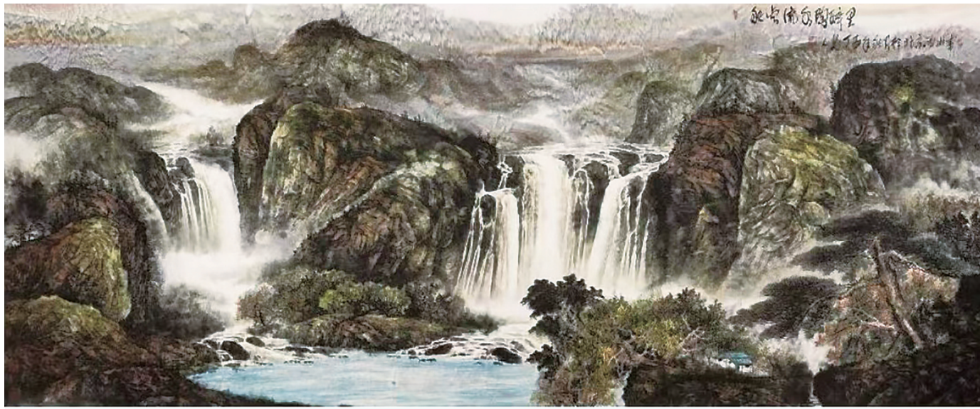
秋云流水陶醉里 刘人岛 作