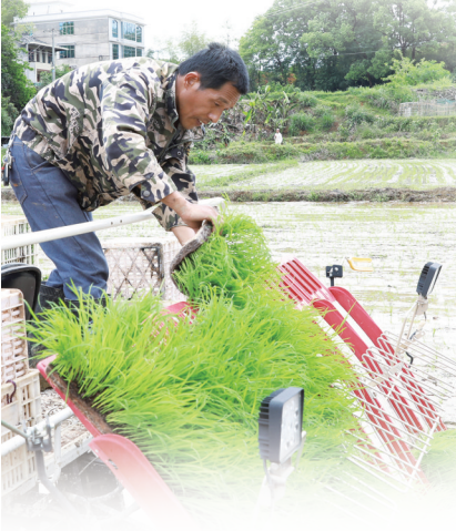
图为我市春耕生产现场。

如高标准农田建设项目、土壤有机质提升项目、秸秆还田项目、商品有机肥补贴项目等;采取工程、农艺、生物措施相结合,切实抓好我市高标准农田建设工作;增施有机肥,提高土壤有机质;开展种养结合、分类施策,促进地力稳步提升。