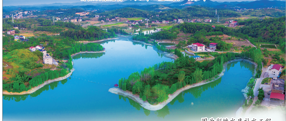
图为彩塘水库补水工程。

10月21日,记者走进大祥区板桥乡金桥村高标准农田改造项目现场,只见这里田成方、渠相通、路相连,田网、渠网、路网等不断完善,有效提高了水资源和耕地利用率,改善了农田生产环境,为农业增产增收打下了良好基础。