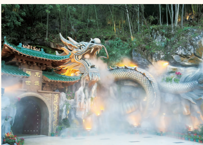
玉龙洞景区八景之一“神龙吐雾”。

2024年上半年,城步苗族自治县接待境内外游客293.9万人次,增幅17.6%;实现旅游综合收入29.8亿元,增幅18.25%。