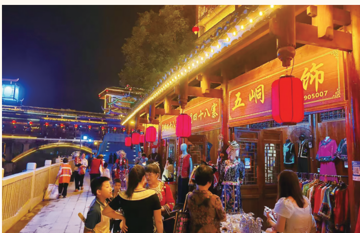
游客观摩民族风情商业街,体验苗乡文化。