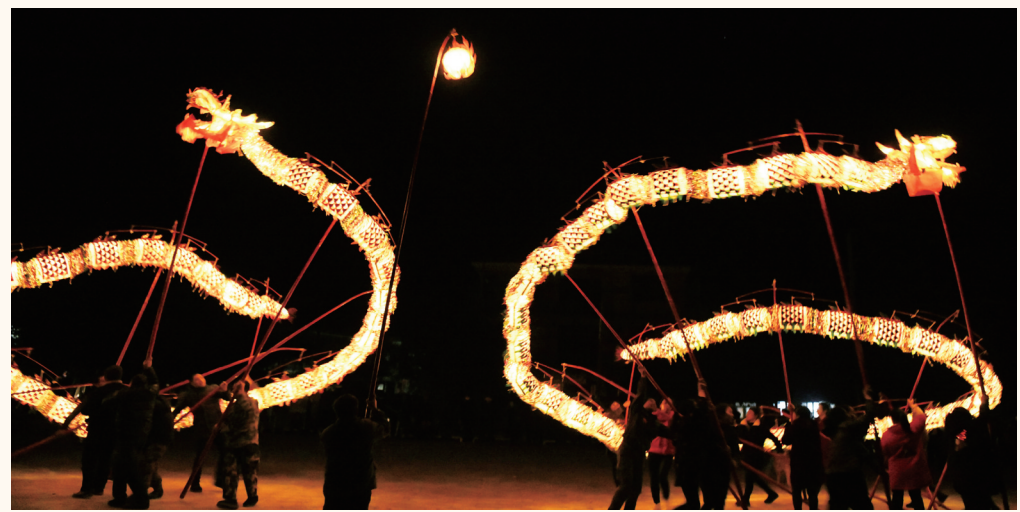
城步吊龙。

“城步太美了!”应邀参加旅发大会宣传报道的媒体记者纷纷表示,这是一道文化盛宴,使人震撼。玉龙洞,鬼斧神工的奇石,在声、光、电的巧妙映衬下,游客置身其中,如置身龙宫,仿佛走进了一座天然雕塑的艺术长廊;城步吊龙是古老而又智慧的舞龙方式,夜幕中,两条活灵活现的火红长龙飞舞跃起,它们围着一颗“龙珠”,一会儿游动,一会儿翻滚,一会儿又相互追逐,“双龙戏珠”的场景让人惊叹……本次旅游发展大会城步共接待各地游客15万人次。