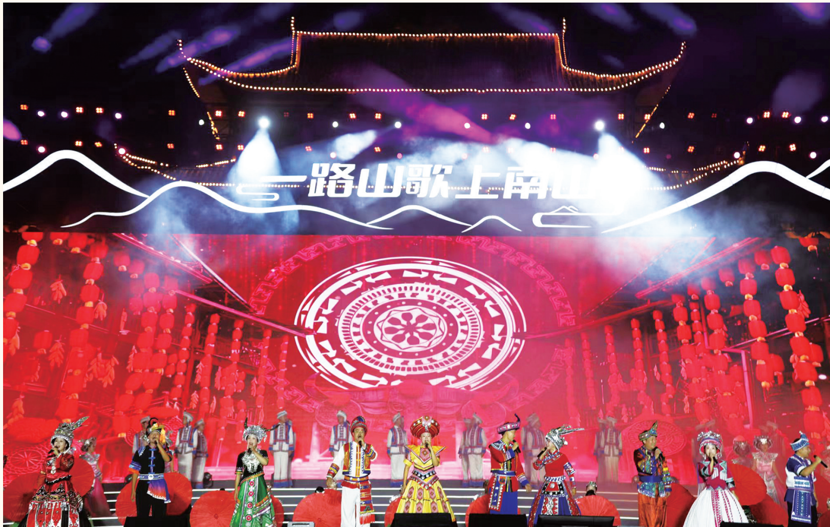
大会文艺演出。

落霞与孤鹜齐飞,秋水共长天一色。9月9日至10日,相聚于巍巍南山脚下、悠悠巫水河畔,以“一路山歌上南山”为主题的第三届邵阳旅游发展大会在城步苗族自治县隆重举行,来自五湖四海的游客同聚苗乡,共襄盛举。