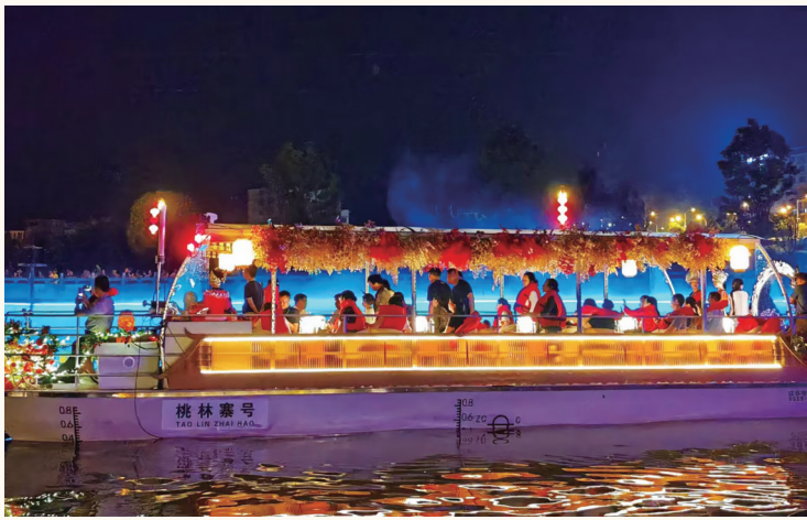
游客乘船夜游巫水河。