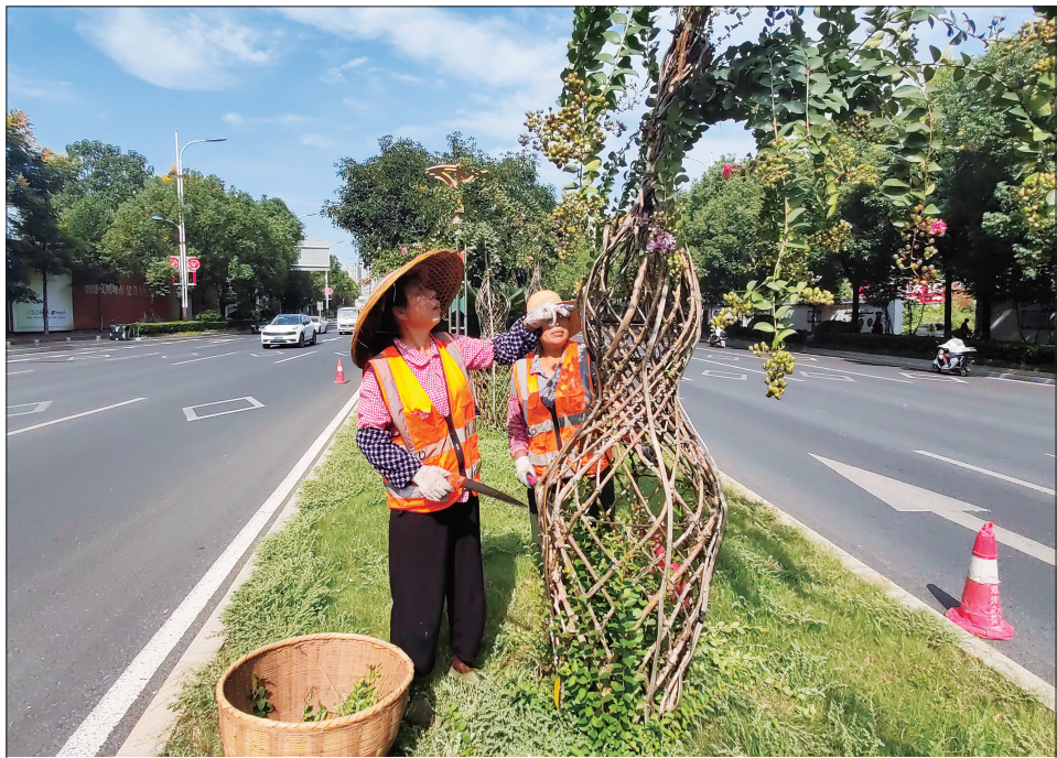
9月2日上午,园林工人在市城区邵阳大道绿化带中进行绿化景观管护,用汗水守护城市绿意。