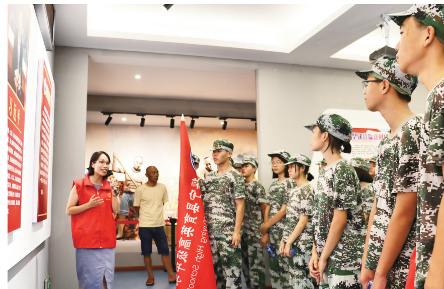
9月4日,绥宁县禁毒办联合该县教育局、县禁毒协会,组织育英中学新生参观禁毒科普教育馆,进一步提升青少年识毒、防毒、拒毒意识,筑牢禁毒思想防线。

为了进一步提升人才培养质量,该校对现有17个专业进行了全面梳理与优化,模具制造、会计、电气自动化设备安装与维修等5个专业新开或转为对口高考班,为学生搭建起通往高等教育的坚实桥梁。同时,汽车维修、汽车电器维修等5个专业也焕新出发,开设对口升学班,畅通技工院校学生的升学通道,助力其实现技能与学历的双重提升。