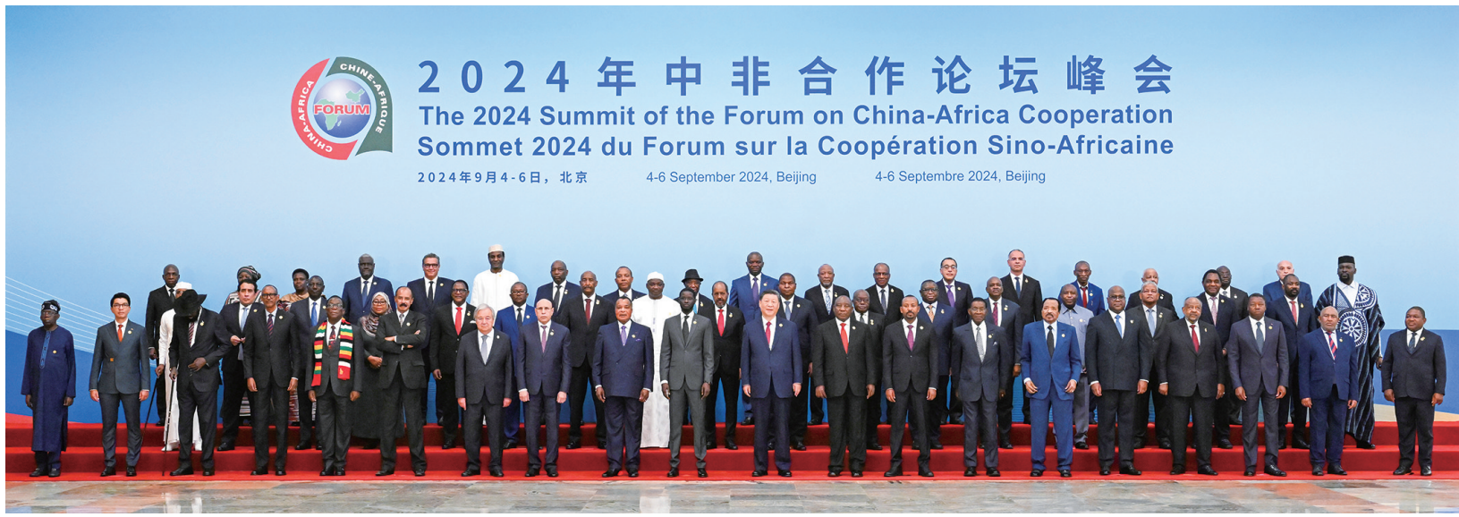
9月5日上午，国家主席习近平在北京人民大会堂出席中非合作论坛北京峰会开幕式并发表主旨讲话。这是开幕式前，习近平同出席峰会的外方领导人集体合影。