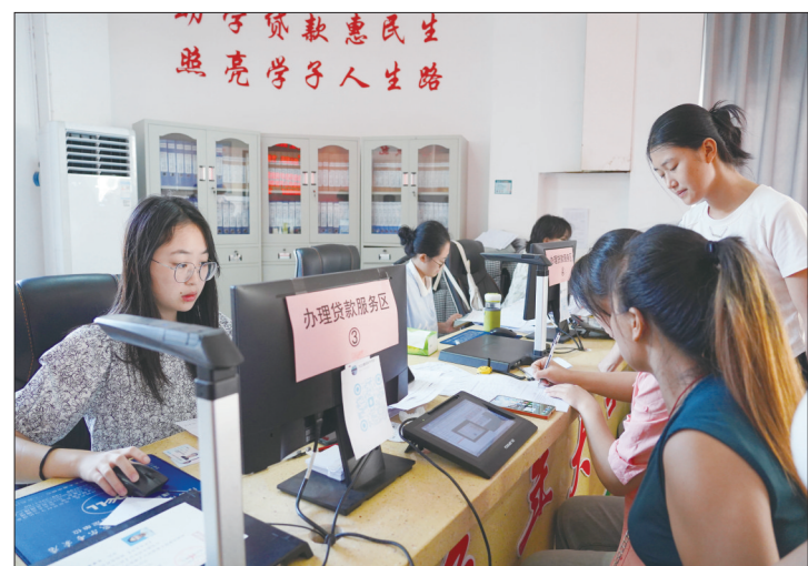
8月29日,隆回县学生资助服务中心,家长正在陪同孩子办理助学贷款手续。今年暑假,隆回县已有3500余名大学生顺利申请了助学贷款。

虽然把学生放在“心尖尖”上,用“培根、铸魂、润心、明理”带动“启智”的教育思想,让刘刚在挚爱的教育之路上苦累并行,但他收获着自己良心上的满足。