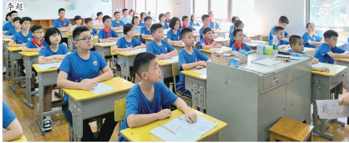
开学当日,市湘塔铭志学校六年级学生在课堂上聚精会神听讲。

暑假悄然过去,9月2日,我市中小学校秋季学期正式开学开讲。在教育行政部门的紧密部署下,各中小学校提前谋划、精心准备,全力确保秋季学期开学安全、平稳、有序。