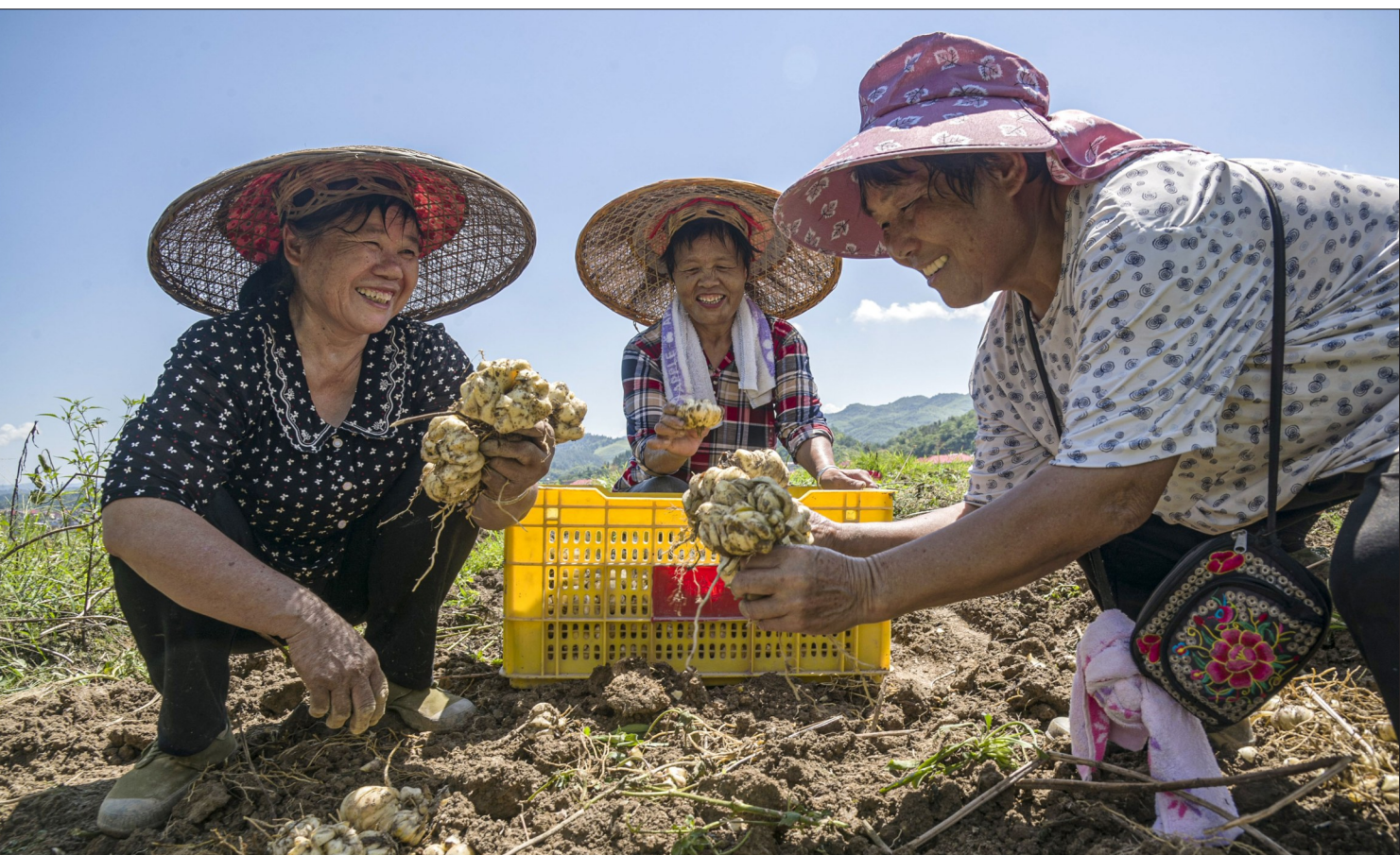
8月24日，武冈市文坪镇安心观村百合基地，采挖百合的村民脸上洋溢着丰收的喜悦。今年，该基地扩大种植面积，用科学方法培植，百合亩产量可达2000公斤。