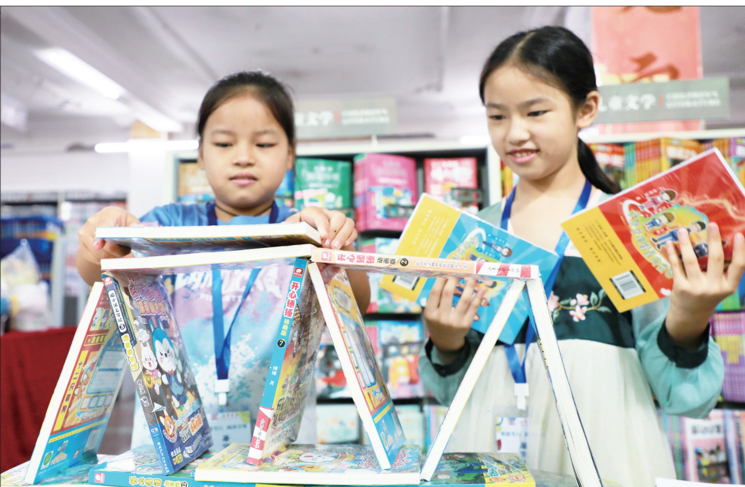
8月16日,邵阳市新华书店“小店长”们正在忙碌工作。暑假期间,该书店特别推出暑假“小店长”社会实践活动,不少热爱阅读的小朋友来到书店“就职”,给图书分类、整理,引导读者寻找图书,丰富暑期生活。