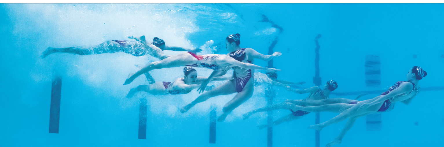
图为中国队在比赛中。

结束了当天的采样工作,他们的身影在烈日下渐行渐远。但那份对环保事业的执着与热爱,却如同这炽热的阳光一般,永远照耀着这片土地,守护着绿水青山。