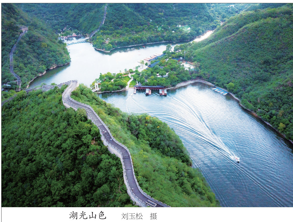
湖光山色