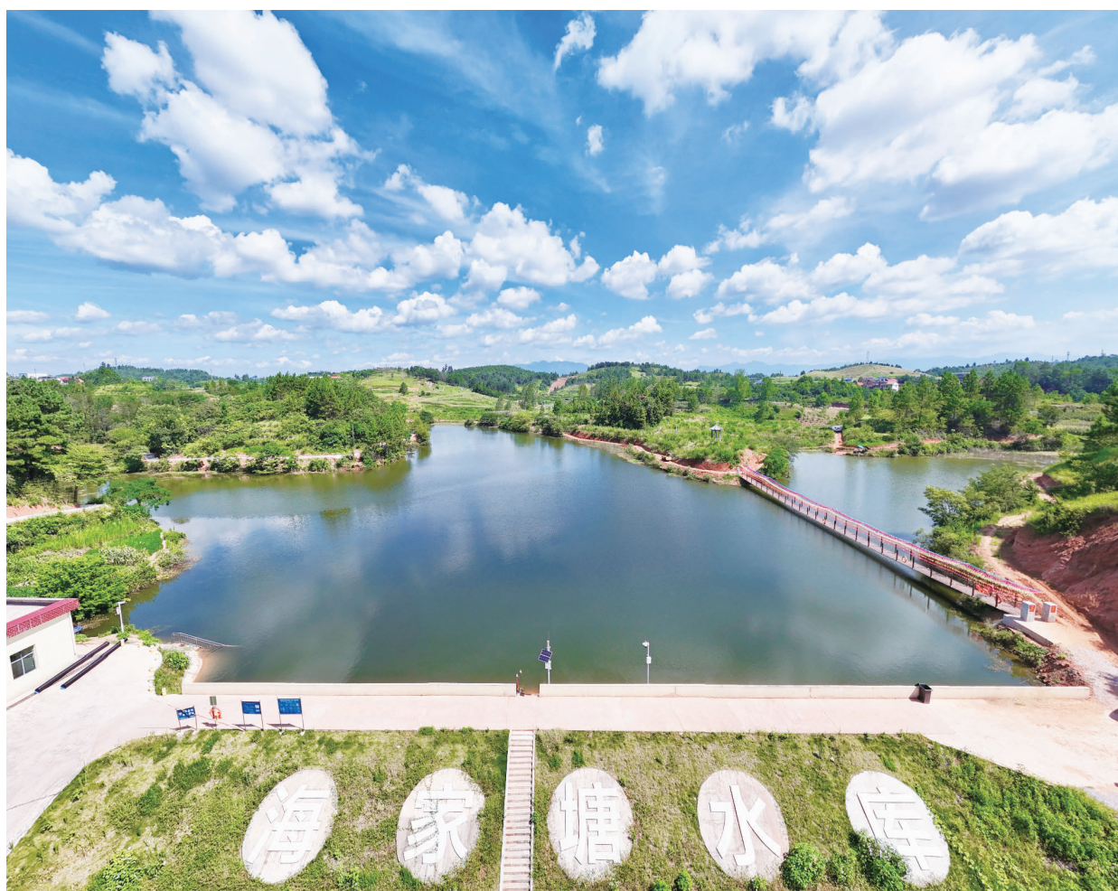
海家塘水库。