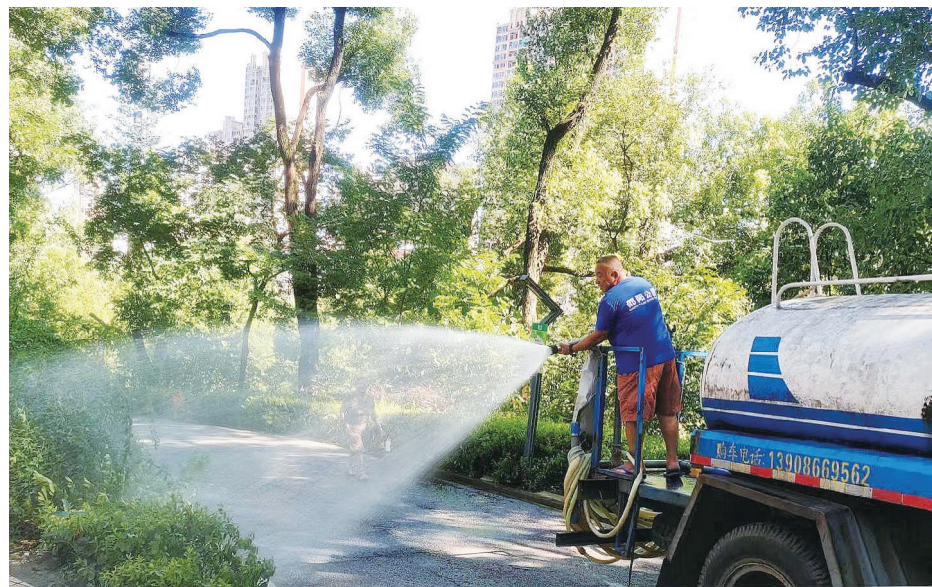
园林绿化养护人员为植物浇水。

市公园管理所相关负责人表示,接下来,将持续关注天气情况,切实管护好公园的绿化植物,确保它们安全度夏,为市民营造优美的公园环境。