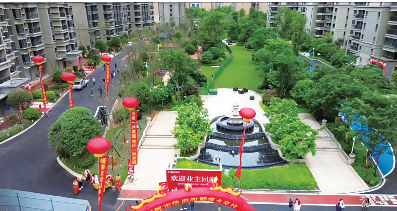
4月30日,都市华府20号栋、21号栋、22号栋达到交付标准并开始交房。