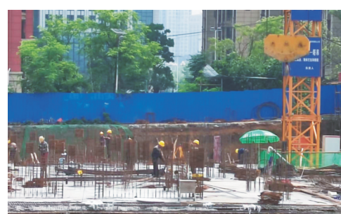
▲5月7日,工人们正在对2号栋进行地下室地板浇筑