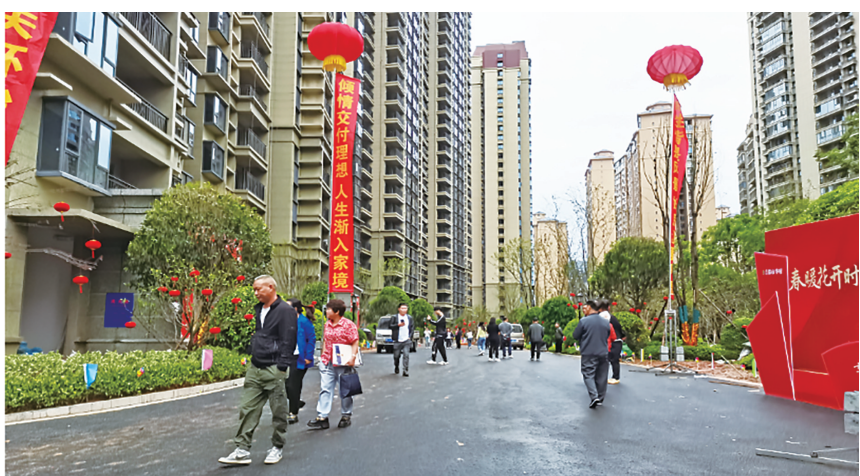
4月30日,都市华府四期部分业主迎来交房时刻。

邵阳通茂公司千方百计加快项目建设,在相关部门的支持、参建单位的配合下,项目部通力协