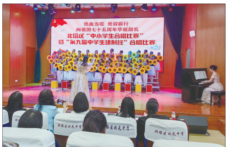
4月23日,“热血当歌,勇毅前行,向祖国七十五周年华诞献礼”北塔区中小学生合唱比赛暨“第九届中学生建制班”合唱比赛在北塔区状元中学举行。精心的编排、整齐的合唱、饱满的精神……充分展示了北塔区中小学美育工作成果和青少年学生的活力与风采。

18年来,米小兰用真心的付出播撒着希望,守护着学生们的健康成长。她也先后获评市教育系统“优秀共产党员”“最美德育工作者”殊荣。