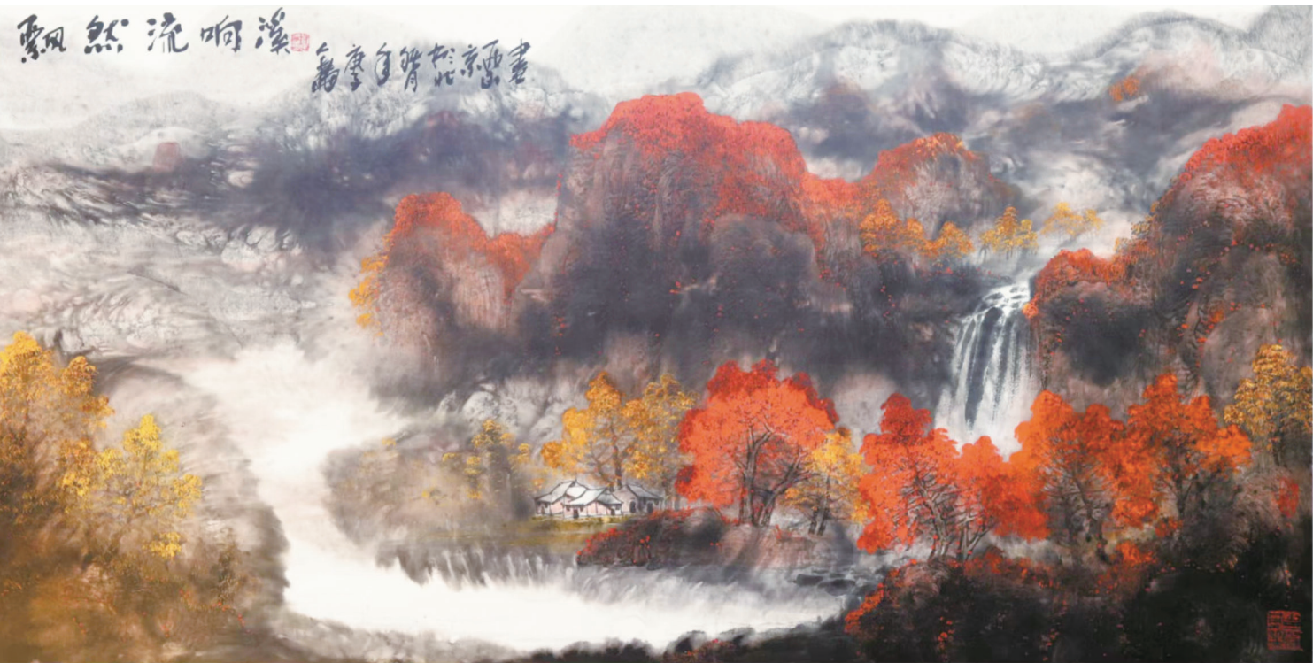
飘然流响溪 刘人岛 作

始终坚持把学习贯彻习近平新时代中国特色社会主义思想作为关心下一代工作最根本的政治任务和政治责任,自觉落实到关心下一代工作各方面和全过程。认真贯彻落实《中华人民共和国爱国主义教育法》,以庆祝中华人民共和国成立75周年为主线,在全市青少年中深入开展“薪火‘湘’传,强国有我”主题教育活动。主要内容是组织引导广大青少年通过学起来、读起来、唱起来、讲起来、做起来,激发“强国有我”的青春激情,展示“挺膺担当”的精神风貌。“学起来”,就是深化习近平新时代中国特色社会主义思想学习教育,激发广大青少年爱党爱国爱社会主义的巨大热情,引导青少年自觉肩负起强国建设、民族复兴伟业的历史使命。“读起来”,就是运用《毛泽东故事》和本土红色故事等读本,开展青少年“中华魂”主题教育活动,教育引导广大青少年深情缅怀伟人丰功伟绩,传承弘扬伟人崇高精神风范,自觉为继续推进毛泽东主席等老一辈革命家开创的事业不断奋斗,为强国建设、民族复兴伟业矢志前行。“唱起来”,就是以歌咏活动、文艺演出等形式唱响颂党爱国主旋律、讴歌强国富民新时代,展现新时代邵阳好少年的良好精神风貌。市关工委将举办“第四届少年儿童文化艺术节”,为少年儿童唱起来提供舞台。“讲起来”,就是举