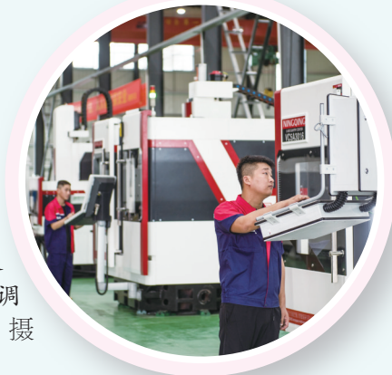
▶宁庆航空航天智能装备工作人员在调试智能设备。