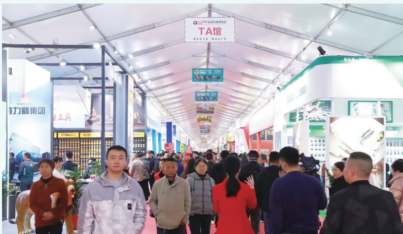
▲2023年五金机电博览会现场火爆。