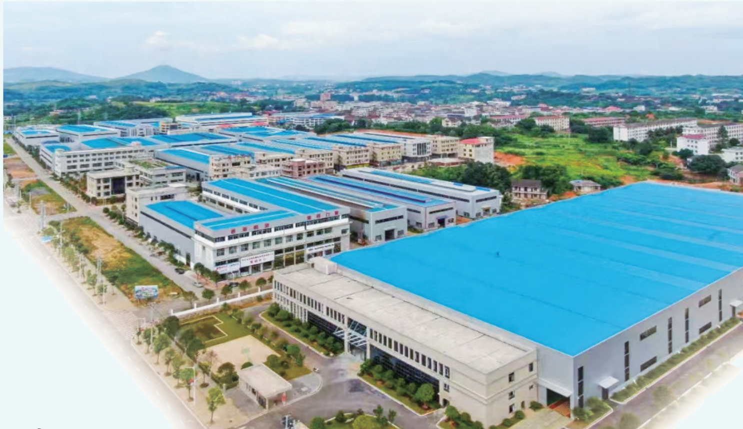
邵东五金科技创新产业园。

春意盎然,激荡万千气象;春潮澎湃,积聚强劲动能。4月5日,千余家国内外企业将携带3500多种优质特色产品齐聚邵东,共赴一场五金行业盛典。