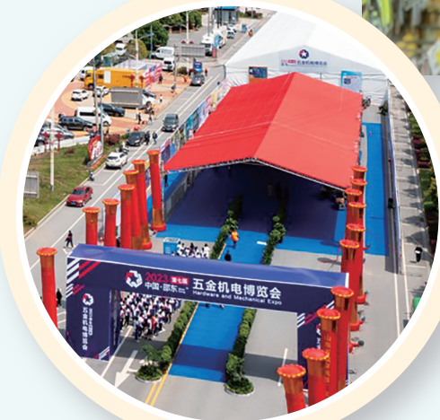
▲2023年五金机电博览会。

五金产业是邵东市五大特色轻工产业之一。该市积极引导五金企业转型升级,不断擦亮仙槎桥五金特色小镇的金字招牌,着重把五金产业作为引领传统产业提质增效的重要突破口,全力打造五金百亿产业集群,挺直县域经济高质量发展的“脊梁”。同时以展会兴产业、以产业促会展,将博览会打造成服务产业发展的大平台,助推经济社会高质量发展。