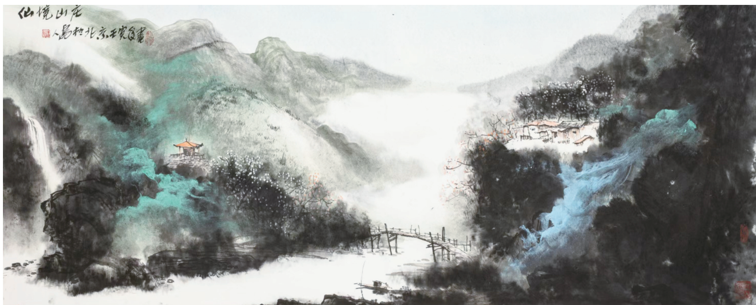
仙境山庄 刘人岛 作