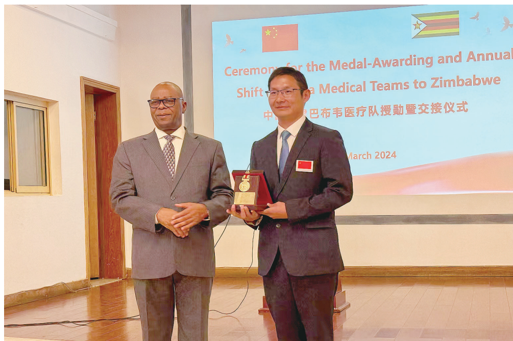
▲津巴布韦卫生部长蒙贝绍拉代表副总统奇温加向李从刚颁发勋章。

“这里有位右侧腰部疼痛1周、高烧发热的危急患者,怎么办?”2023年5月11日,电话那头传来当地医师Mutomba