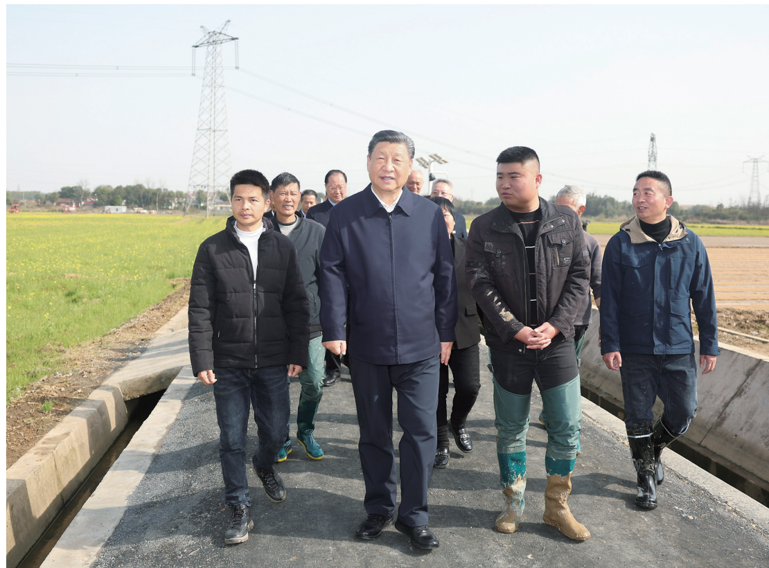
3月18日至21日,中共中央总书记、国家主席、中央军委主席习近平在湖南考察。这是19日下午,习近平在常德市鼎城区谢家铺镇港中坪村,同种粮大户、农技人员、基层干部亲切交流。

新华社长沙3月21日电 中共中央总书记、国家主席、中央军委主席习近平近日在湖南考察时强调,湖南要牢牢把握自身在构建新发展格局中的战略定位,坚持稳中求进工作总基调,坚持高质量发展不动摇,坚持改革创新、求真务实,在打造国家重要先进制造业高地、具有核心竞争力的科技创新高地、内陆地区改革开