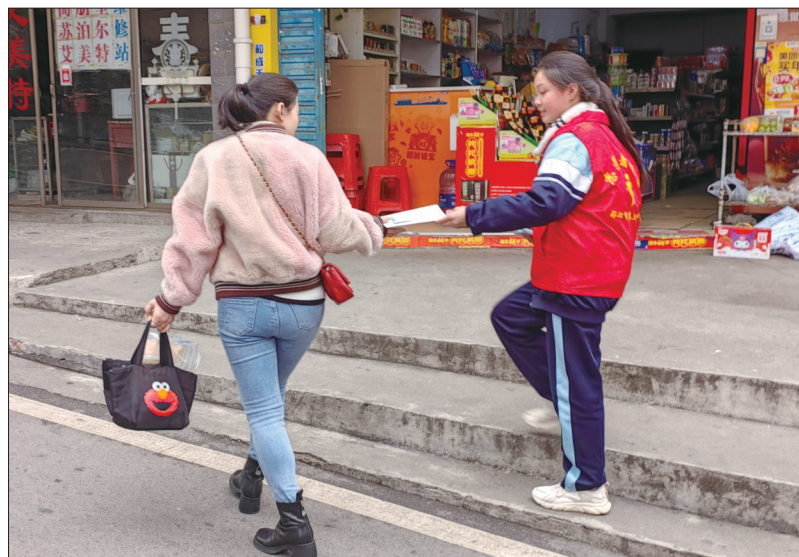
3月5日,市三中学生志愿者在双清区百寿亭社区开展“情暖社区 义务清扫”“创文知识宣传”主题教育活动,践行雷锋精神。图为志愿者向社区居民发放文明创建宣传资料。

竞技水平稳中有进。2023年,我市坚持特色发展,打造“一校一品”“一校多品”,建立市、县、校“三级”常赛制度,体艺竞技硕果累累。由市七中和市二中组成的代表队在2023年全国中学生田径锦标赛上摘得一金三银一铜,初中男子团体总分排名全国第三,初中男女团体总分排名全国第八名;邵东市城区四完小获2023年湖南省青少年校园足球男子组比赛一等奖,双清区高崇山中心完小获女子组比赛二等奖;在第五届省中学生运动会上,我市代表团获团体总分第六,女子篮球、跆拳道等项目在此次比赛中实现突破,我市也成功申办2025年第六届省中学生运动会。在2023省“三独”比赛决赛中,我市学生共获得一等奖5个、二等奖13个、三等奖14个。