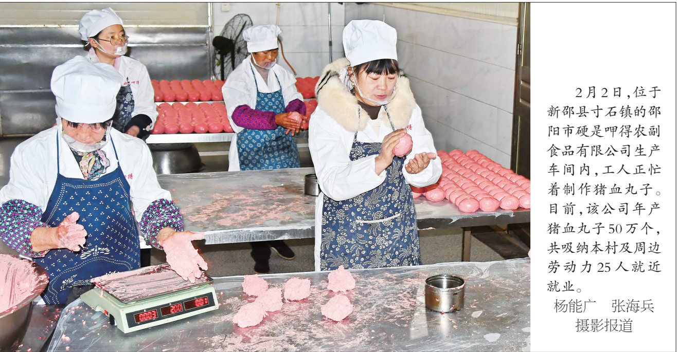
2月2日,位于邵阳县石镇的邵阳市硬是呷得农副产品有限公司生产车间内,工人正忙着制作猪血丸子。目前,该公司年产猪血丸子50万个,共吸纳本村及周边劳动力25人就近就业。

在扬子巴士公司,贺源详细了解公交安全出行情况,看望慰问困难职工。他表示,近年来,全体员工付出了艰辛努力和大量汗水,为群众便捷、舒适、平安出行提供坚强支撑,希望大家一如既往往落实安全措施、提升服务水平,以优质服务满足群众美好出行需求。