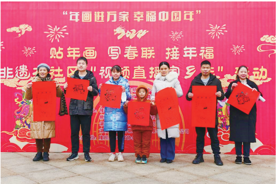
▲社区居民展示印制的滩头木版年画。

据了解,当日共有1000余名社区居民参加了年画印制体验活动,共送出春联600余副,年画1200余幅,线上观众达到10000人次。