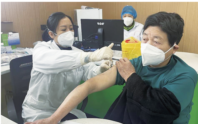
积极推进疫苗接种工作，确保群众健康安全。