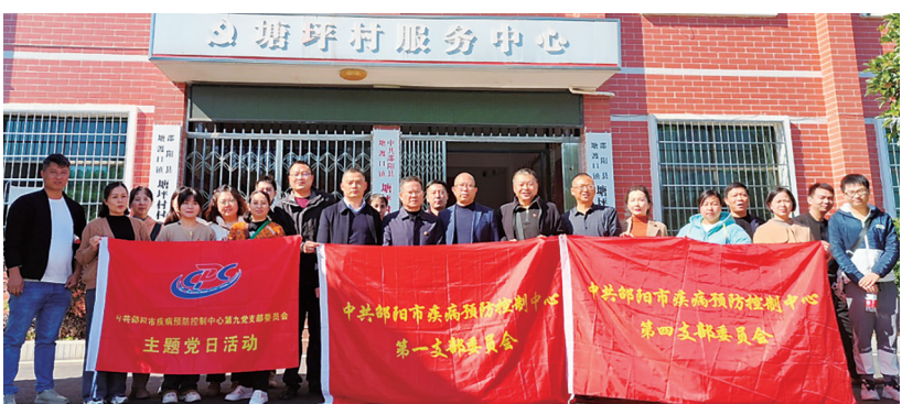
市疾控中心组织党员到邵阳县塘渡口塘坪村开展“一月一课一片一实践”主题党日活动。

党建引领合力推进，党建业务“双促双融”，领导干部率先示范，党员群众凝心聚力。目前，该中心全体人员思想稳定、斗志昂扬，坚守初心、不忘使命，内涵建设持续加强，中心上下焕发蓬勃生机。