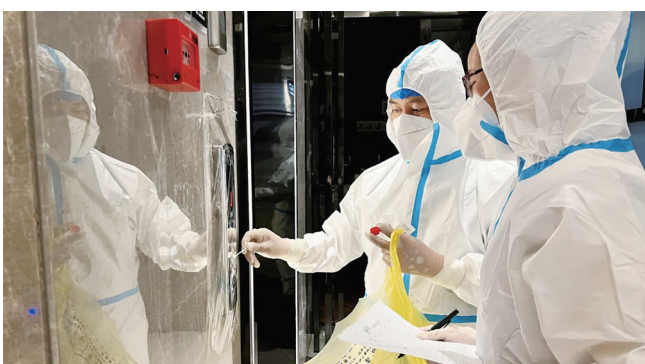
新冠肺炎疫情防控期间，采样组在电梯间采样。

“21世纪最贵的是人才，人才是第一资源。”市疾控中心历届领导班子牢固树立这一指导思想，积极加强人才队伍建设，多措并举引进人才。近年来，该中心自主组织招聘考试，招聘21人，其中研究生4名、本科生17名，不断激发人才活力。