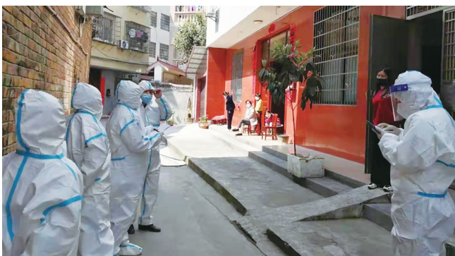
流调队进村入户开展溯源调查。