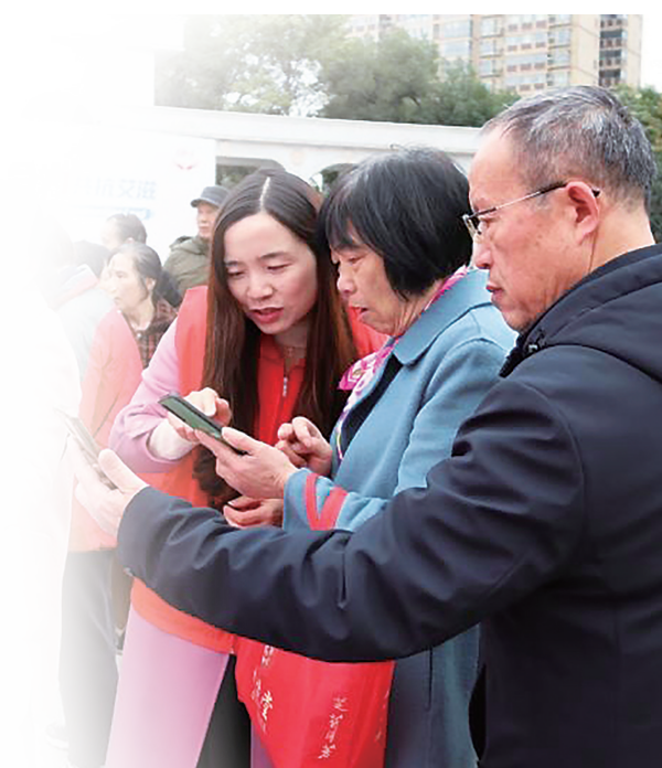
市疾控中心组织志愿者进街道、进社区开展疾病预防控制、健康教育宣传活动。

同时，市疾控中心积极加强信息化建设，大力推进医防融合、条块结合，着力实现数字化转型，努力实现打造“智慧疾控”的长远目标。该中心充分利用已有的信息平台，将各种现代通信技术、自动化设备和实验室自动化系统引入到疾控中心数字化建设中。近年来，该中心全面保障中国疾控中心传染病疫情网络直报系统安全、稳定运行；以门户网站、微信公众号、微博为抓手，促进信息开发工作；启动了传染病监测预警与应急指挥信息平台建设。