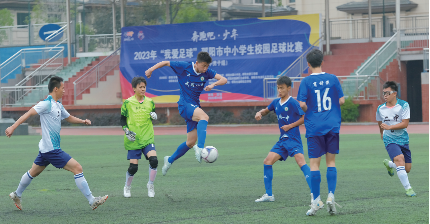
11月7日,2023年“我爱足球”邵阳市中小学生校园足球赛开赛。此次比赛由市教育局、市文旅广体局主办,为期8天。比赛分小学男子甲组、小学男子乙组、小学女子组、初中男子组、初中女子组、高中男子组、高中女子组七个组别,来自全市各地的69支代表队、1179名运动员展开激烈角逐。

目前,非遗文化传承已经成为邵阳职院的品牌。2022年,该学校“以文化人、以文润心:‘一馆三化四链’打造邵职非遗文化”荣获湖南省校园文化建设经典案例。邵阳职院投入近300万元建设非遗产业学院,致力打造技能培训、服装定制、文创产品研发等五大板块,积极探索“高校+企业+基地”非遗进校园模式,紧密结合地方非遗资源,实现政府、企业、学校和传承人四方联动,推动教育链、产业链、人才链与创新链有效衔接,实现经济效益、文化效益、社会效益共赢。