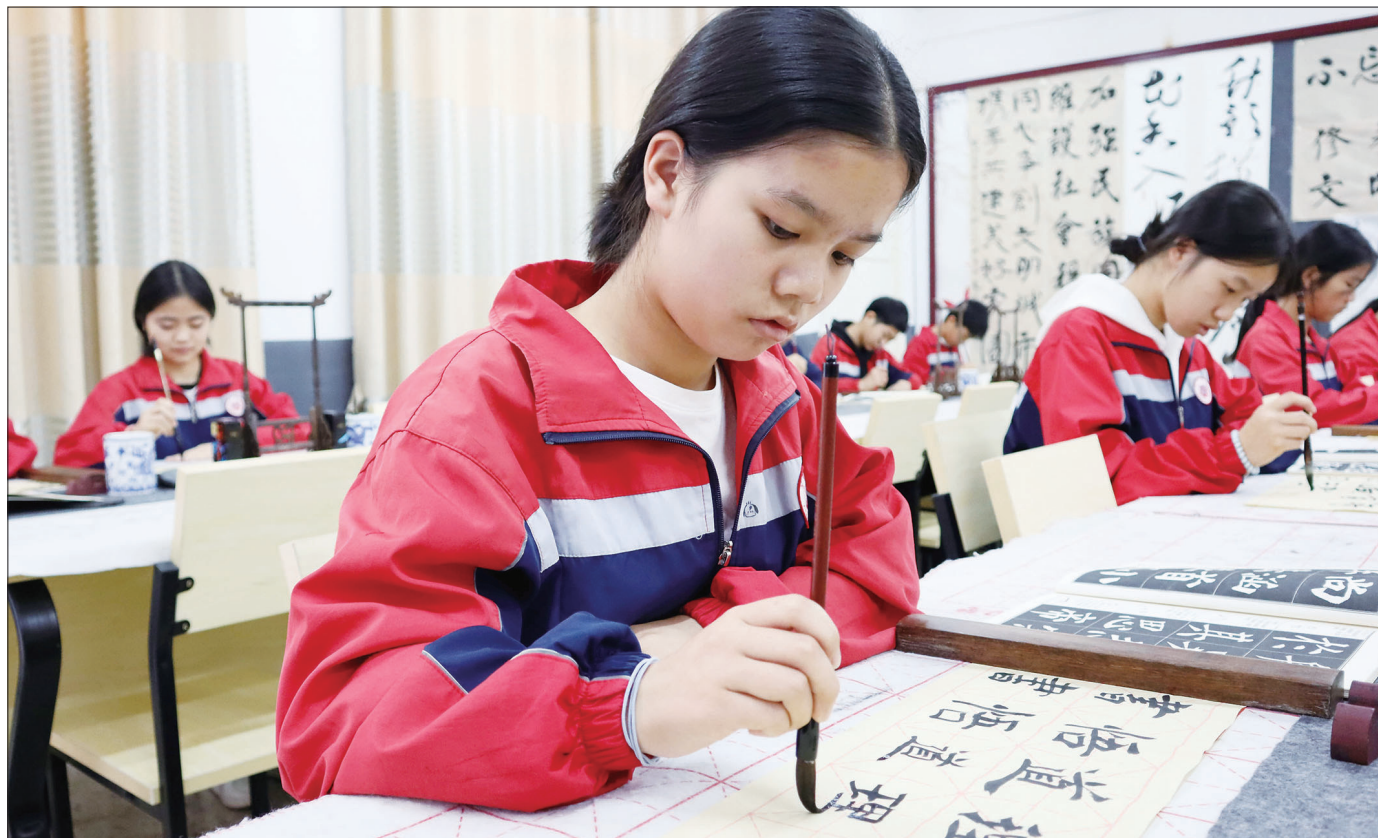
11月1日,城步苗族自治县芙蓉学校的学生在练习书法。今年以来,该县各校开设书法、苗绣、山歌等民族文化特色课程,让校园生活变得丰富多彩。

升。加大案件监管力度,狠抓审判质量;做好服判息诉工作,重视审判效果;发挥审判效率优势,推动质效整体提升。要压紧压实责任,确保实现全年目标任务。党组要高度重视,抓好执法办案主责主业;院庭长要狠抓落实,以“阅核制”为抓手,全面准确落实司法责任制;审管办要强化监管,履行好组织调度、监督管理、考核评价的职责。要严格履职尽责,奋力营造廉洁、安全、智慧的执法办案环境。严肃纪律作风,树立正确的政绩观,牢记“两个永远在路上”,严管厚爱,带好队伍;强化安保维稳,一体推进审判执行、队伍建设、警务安保、安全保密、信访维稳、舆情引导等工作,坚决消除各类风险隐患;坚持需求导向,聚焦服务审判执行工作和满足群众司法需求,进一步加快智慧法院建设。