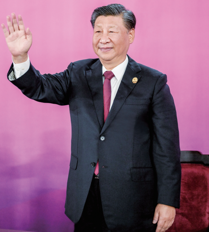
9月23日晚,第十九届亚洲运动会在浙江省杭州市隆重开幕。这是国家主席习近平在主席台上向大家挥手致意。