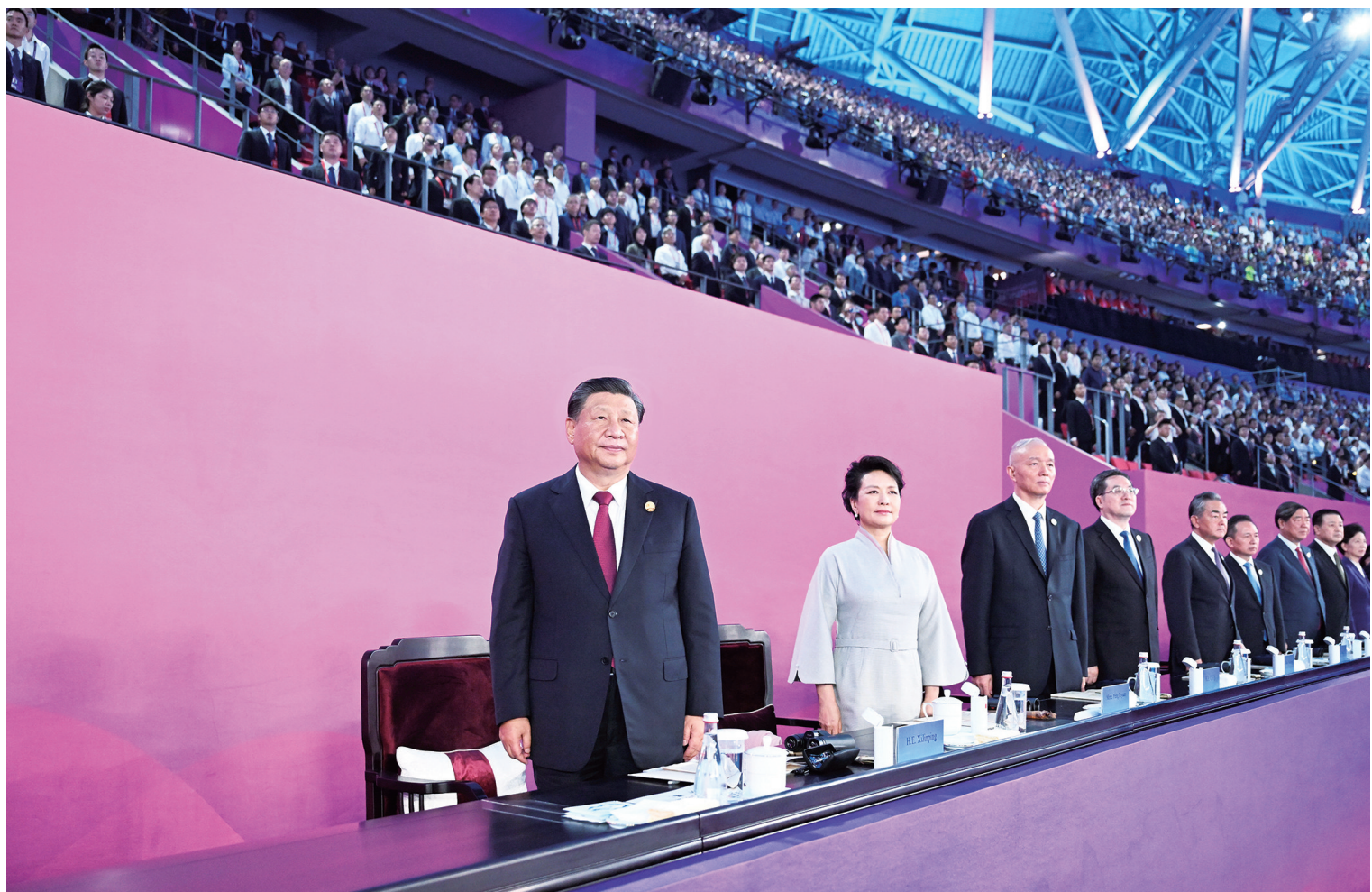
9月23日晚,第十九届亚洲运动会在浙江省杭州市隆重开幕。习近平、蔡奇、丁薛祥等党和国家领导人出席开幕式。