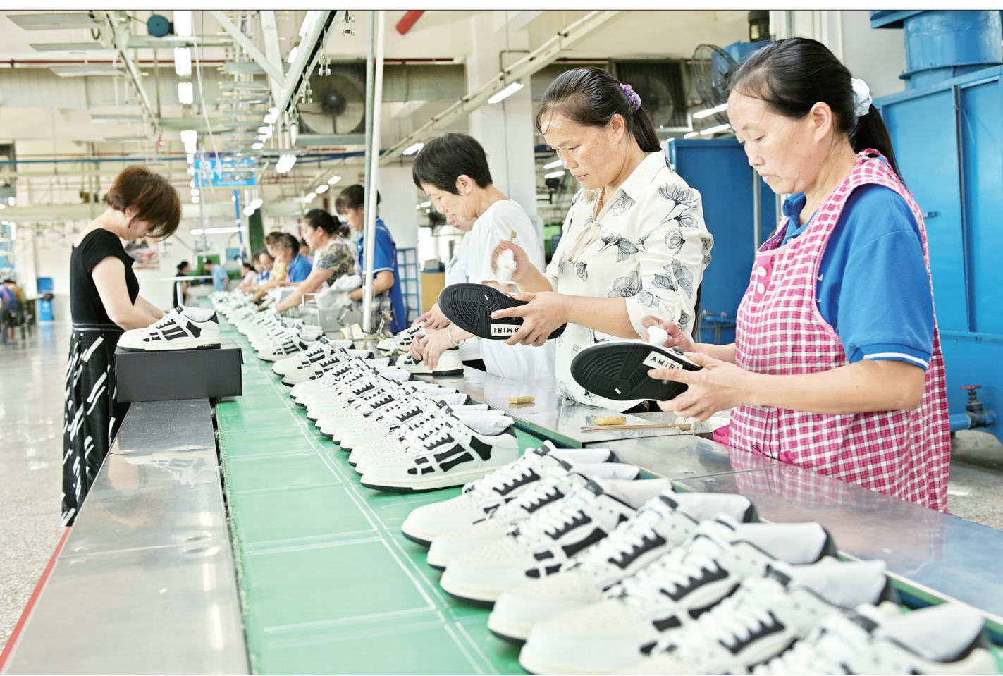
8月4日,位于洞口经开区的洞口兴雄鞋业有限公司生产车间内,员工在生产鞋类产品。近期,该县民营企业在当地稳岗用工、金融支持等系列助企纾困措施的扶持下,呈现产销两旺的良好势头。

“用”活闲置低效存量资金。该局按照“实事求是、具体分析、客观处理”的原则对存量资金进行分配,收回的存量资金统筹用于衔接推进乡村振兴、兜牢基本民生保障底线、债务化解等支出领域,提高资金使用绩效,实现了财政资金效用的最优化。