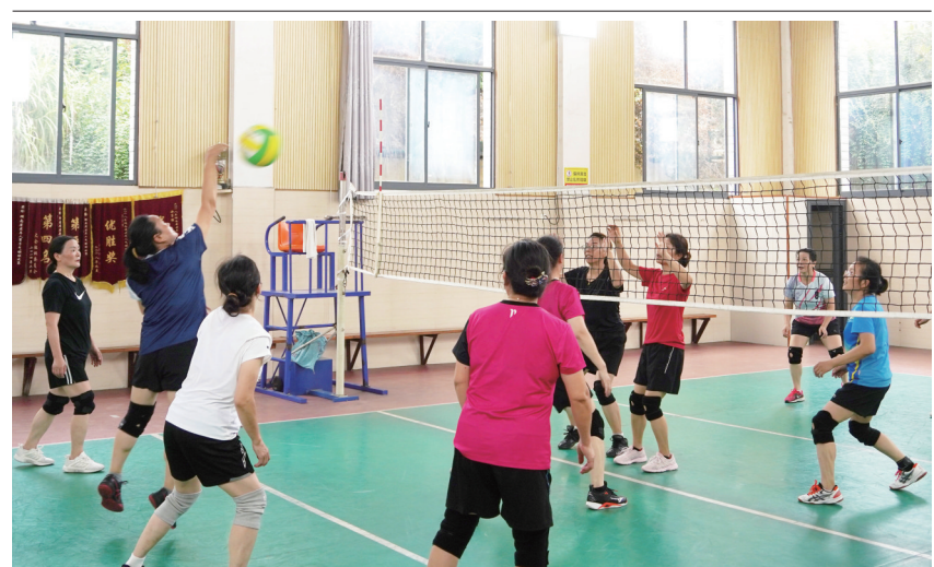
8月2日,气排球爱好者在面向公众免费开放的绥宁县民族体育馆练习气排球。当日,该县启动“全民健身体育宣传周”系列活动,广泛深入宣传和组织开展方便群众参与的民族趣味体育活动,唱响“全民健身、全民参与、全民快乐、全民和谐”主旋律。

突出帮扶强消费。该县以“招商引资+基地认证+粮食订单”消费帮扶模式为纽带,联合邵阳大湾集配农业科技有限公司,以粤港澳大湾区市场充足的粮食订单为基础,积极创建粤港澳大湾区“菜篮子”工程邵阳配送中心,并为该县粮食主产区基地申请粤港澳大湾区“菜篮子”生产基地认定。同时,依托“邵阳红”优质农产品公共品牌的渠道资源,让“隆平五丰稻”进社区、进学校、进机关、进食堂、进商户。