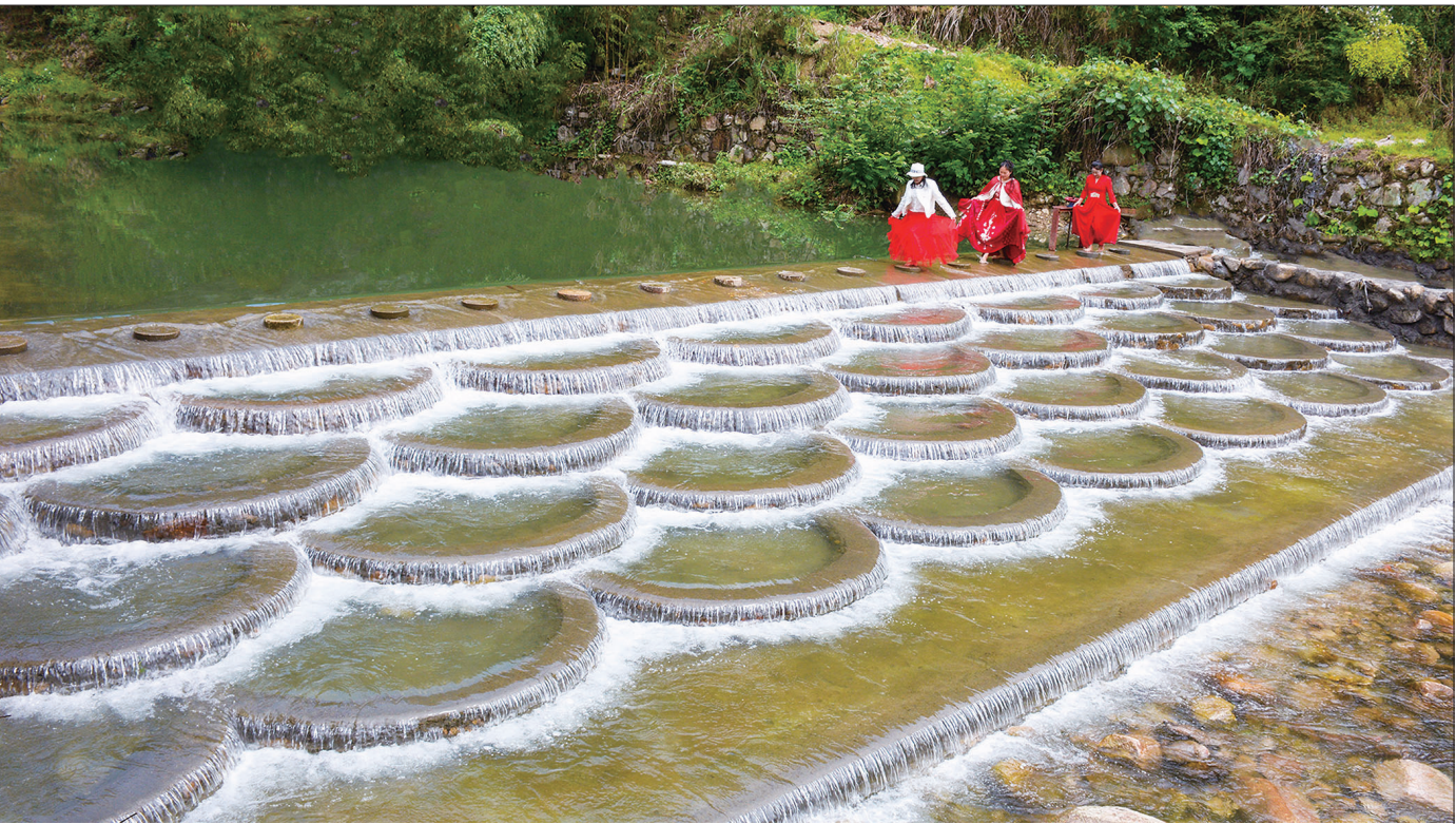
5月12日,游客在新宁县麻林瑶族乡三水村刚修建好的鱼鳞坝上打卡游玩。

此次崑山入选“长江世界遗产之旅”线路,将串联起九寨沟、丽江古城、黄山、苏州古典园林、杭州西湖、湖南武陵源风景名胜区等世界文化和自然遗产,形成集灵山秀水与深厚文化为一体的世界遗产旅游长廊,吸引旅游爱好者探索和发现长江文化和自然之美,打造独具魅力的中华文化旅游体验。