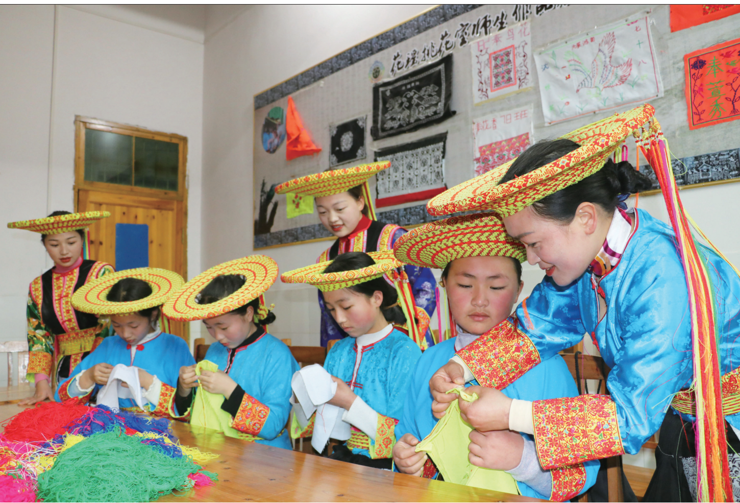
3月10日,隆回县虎形山瑶族乡九年一贯制学校桃花社团教师在指导学生开展纯手工挑花。近年来,隆回县把“花瑶挑花”“滩头年画”“木偶戏”等非物质文化遗产保护项目纳入中小学社团课程,引导学生感受、传承非物质文化遗产,使非物质文化遗产代代相传。

省委、省政府“三大支撑八项重点”工作之一,也是市政协发挥自身优势、围绕中心服务大局的着力点、发力点。3月13日,市委办公室、市政府办公室、市政协办公室联合印发《邵阳市政协2023年度协商与监督工作计划》,将“积极吸引邵商回归和返乡创业”确立为今年市政协第一个专题议政性常委会会议协商课题。该课题调研组由市政协领导带队,邀请部分政协委员、专家学者、相关单位负责人、企业家代表参加。调研期间,调研组将采取网络讨论、市县联动、走访交流、对比调研、座谈交流等方式,围绕我市引商回归创业的重点、难点、痛点等问题开展调查研究。今年6月,市政协将围绕该课题召开专题议政性常委会会议,形成履职成果。