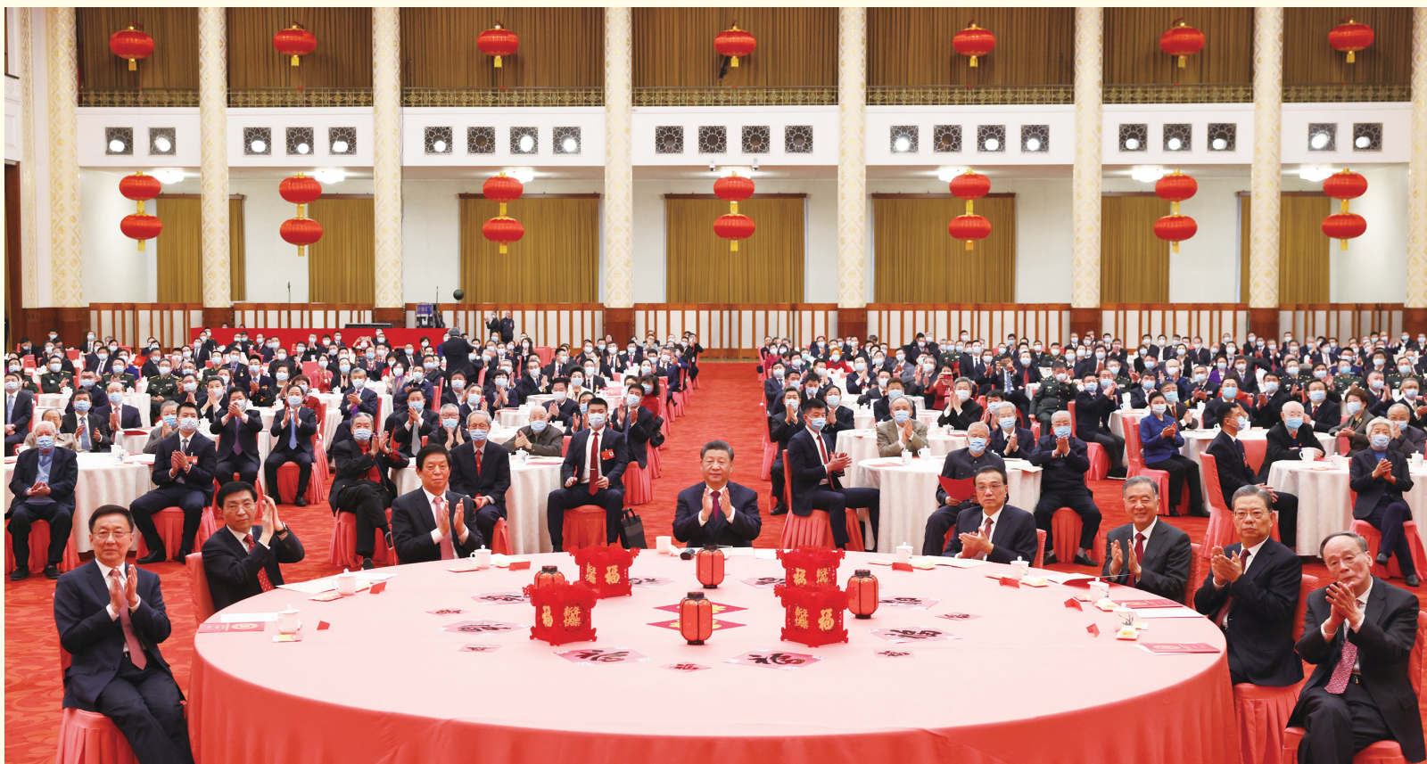
1月30日，中共中央、国务院在北京人民大会堂举行2022年春节团拜会。党和国家领导人习近平、李克强、栗战书、汪洋、王沪宁、赵乐际、韩正、王岐山等同首都各界人士欢聚一堂，共迎新春。