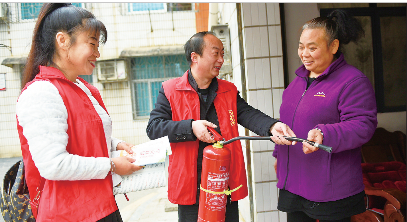
为进一步加强社区消防安全管理，维护辖区和谐稳定，大祥区城西街道樟树坳社区近期组织开展消防安全大排查并入户开展消防知识宣讲。图为12月10日，社区志愿者上门手把手教辖区居民正确使用灭火器。

“发展才是社会主义，发展必须致力于共同富裕。”当前和今后一个时期，认真践行以人民为中心的发展思想，矢志不渝增进三湘人民福祉的目标，就是要推动共同富裕取得更为明显的实质性进展。党的十八大以来，党中央把握发展阶段新变化，把逐步实现全体人民共同富裕摆到了更加重要的位置。省党代会报告形成专门一章，谋定未来五年湖南“着力保障和改善民生，促进全体人民共同富裕”的前行方向。透过浓浓暖意的字眼，传递出与时俱进的民生发展决心，标志着事在人为的坚定信心，预示着湖南人民的生活将更有质量、更添成色。 谋度于义者必得，事因于民者必成。人民对美好生活的向往，就是共产党人的奋斗目标。我们相信，有以习近平同志为核心的党中央的坚强领导，有新一届省委不忘初心、牢记使命，答好新时代赶考路上新考卷的勇毅，富强民主文明和谐美丽的社会主义现代化新湖南的美好愿景一定会如期走进湖南人民的现实。