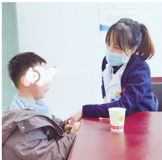
▲医务人员暖心安慰小朋友。

聚焦流程,科学接种有“深度”。据了解,医护人员以班级为单位为儿童进行疫苗接种工作,等候区、登记区、接种区、留观区等区域指引清晰,各区域均有工作人员为儿童开展流程指引、维护现场秩序,儿童在指引下有序