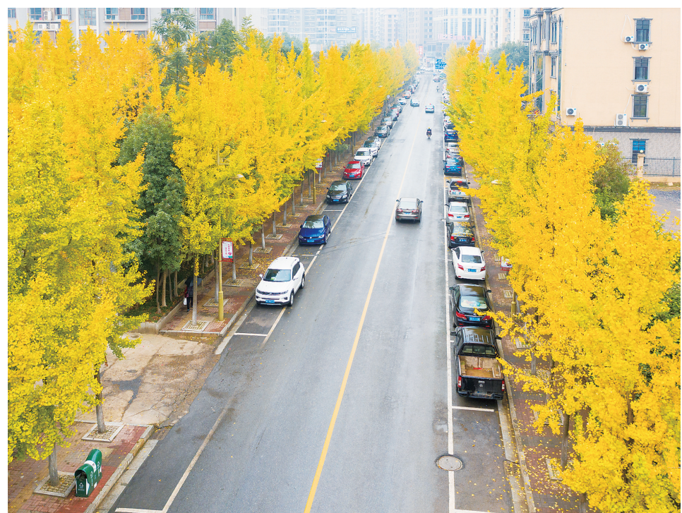
11月16日,大祥区人大路,道路两侧近百棵银杏树叶变得金黄,将初冬时节的道路妆点得分外美丽。车辆行人犹如穿行在金色大道。

活动中,交警还介绍了交通信号灯、标志标线等的含义,讲解如何遵守这些交通信号,引导学生自觉遵守道路交通法规,增强安全意识和自我保护能力。