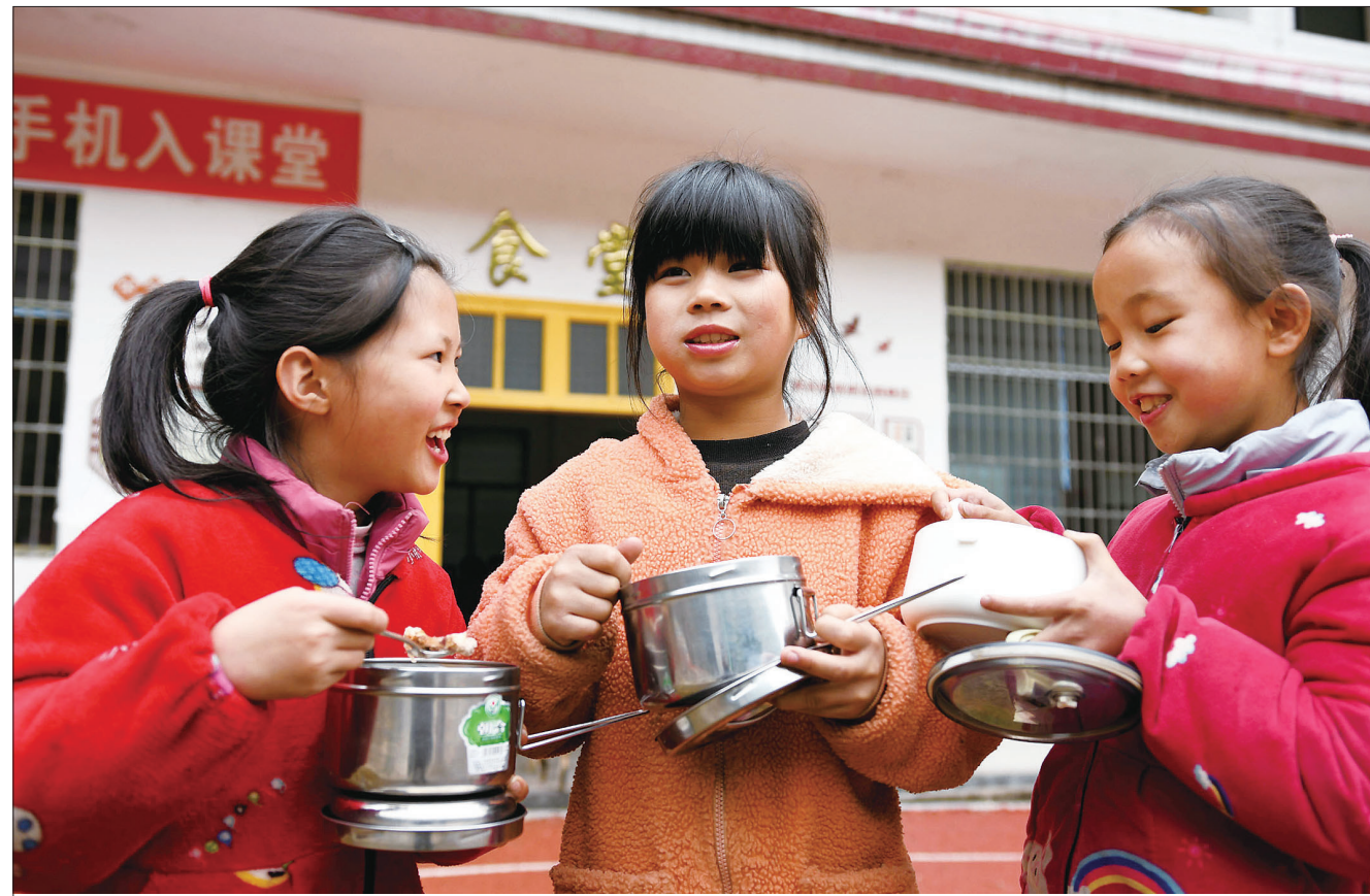
11月15日,城步苗族自治县儒林镇浆坪中心学校,学生在吃提标后的营养餐。据悉,今年下学期起,国家将农村义务教育阶段学生营养餐标准提高。

会议强调,《条例》立法工作要立足邵阳实际,压实各方责任,把握时间节点,统筹做好各环节工作。要集思广益,通过征求意见、调查研究、加强交流,广泛听取群众建议,借鉴外地先进经验,确保《条例》能够落地、务实管用。要突出重点,进一步明确保护范围、细化保护标准,突出以人为本,使传统村落保护与村民生产生活相结合。要厘清责任,明确县、乡、村以及市政府职能部门工作职责,引入社会资本,做好开发利用,确保传统村落保护工作实现高质量、可持续发展。