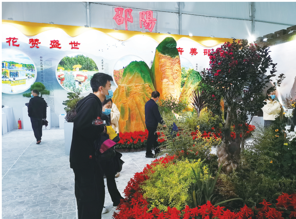
别具匠心的邵阳馆吸引观展人员驻足观看。

邵阳日报讯 (记者 肖燕 通讯员 罗茂智 袁岚) 10月15日至17日,2021年湖南省花木博览会在长沙举行。展会期间,别具匠心的邵阳馆内群芳竞秀、花木多姿,与宝庆古城墙、崑山、南山等景观图浑然一体、相映成趣,吸引观展人员驻足观看。