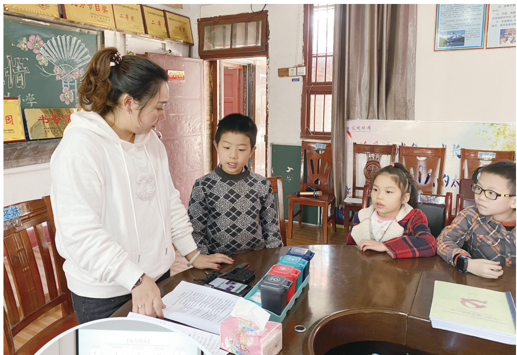
▲“垃圾分类小能手”公益课堂。

此外,为增强小记者的团队协作能力,11月12日,小记者协老师还来到双清区东塔小学二校区,为新入会的小记者开展了一场趣味拓展活动。通过传递呼啦圈、单手传递乒乓球等小游戏,不但丰富了小记者的课余生活,更让小记者在游戏中有所感悟、有所提高。