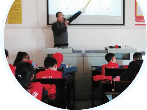
▲硬笔书法基础知识培训。